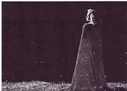
Gleich doppelten Erfolg mit „Silvia“ hatte der Stadtsteinacher Klaus Röbner. Er gewann souverän die Juni-Runde des FAC-Wettbewerbs „Bild des Monats“ und sicherte sich außerdem den zweiten Platz.

Mitglied der Fédération Internationale de l'Art Photographique (FIAP)