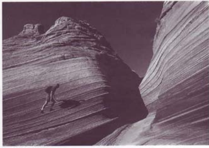
Reiner Großkopf, Navajo Sandstone, U