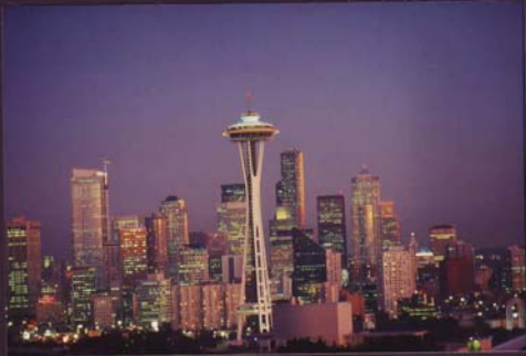
DVF Bundesdiaschau 1996