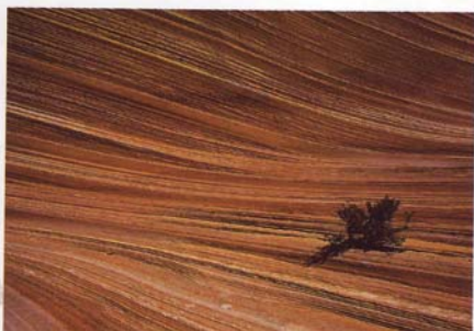
Rainer Großkopf, Struktur, M+SP